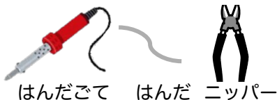
はんだごて はんだ ニッパー

*はんだごての先端の金ぞくはともあつくなるのでぜったいにさわらないでください!!